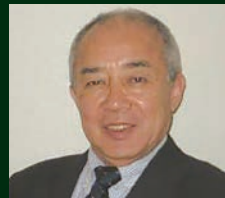
後藤 純一 高知大学 名誉教授