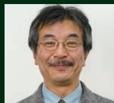
土屋 俊幸 東京農工大学 名誉教授