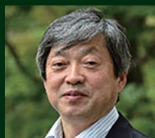
酒井 秀夫 東京大学 名誉教授